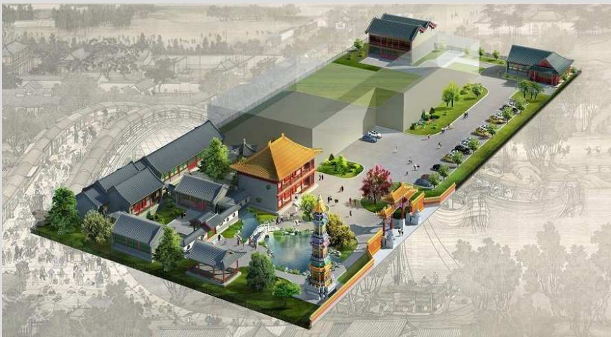
Die chinesische Parkanlage des künftigen China Industry & Trade Centers (Akupunkturklinik, Unternehmertreffpunkt, Teehaus, Managerschule) dürfen Sie in den Tagungspausen kostenlos nutzen.