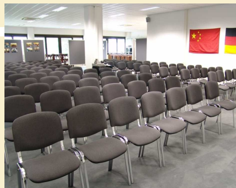
Der große Veranstaltungsraum bei maximaler Bestuhlung

15% Rabatt für Mitglieder des Chinesischen Industrie & Handelsverbandes in Deutschland e.V.