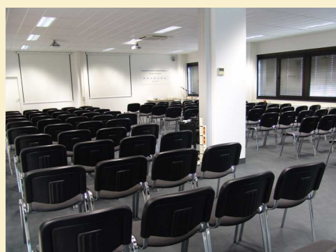
Moderne Präsentationstechnik mit großer Projektionsfläche