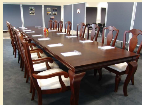
Tagungskonstellation und Ausstellungsflächen (Beispiel)