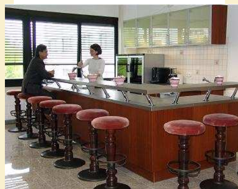
Im Service in begriffene Nutzung der hauseigenen Bar