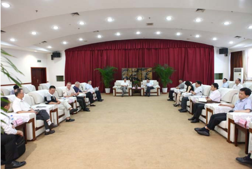
代表团与黄山市政府进行座谈