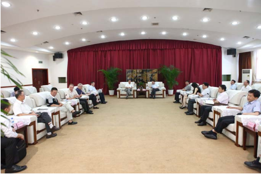
代表团与黄山市政府进行座谈