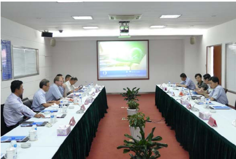
代表团与昌辉集团公司进行会谈