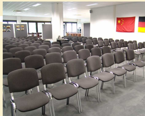
Der große Veranstaltungsraum bei maximaler Bestuhlung

15% Rabatt für Mitglieder des Chinesischen Industrie & Handelsverbandes in Deutschland e.V.