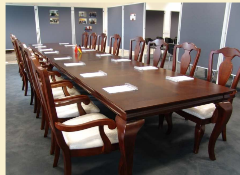
Tagungskonstellation und Ausstellungsflächen (Beispiel)