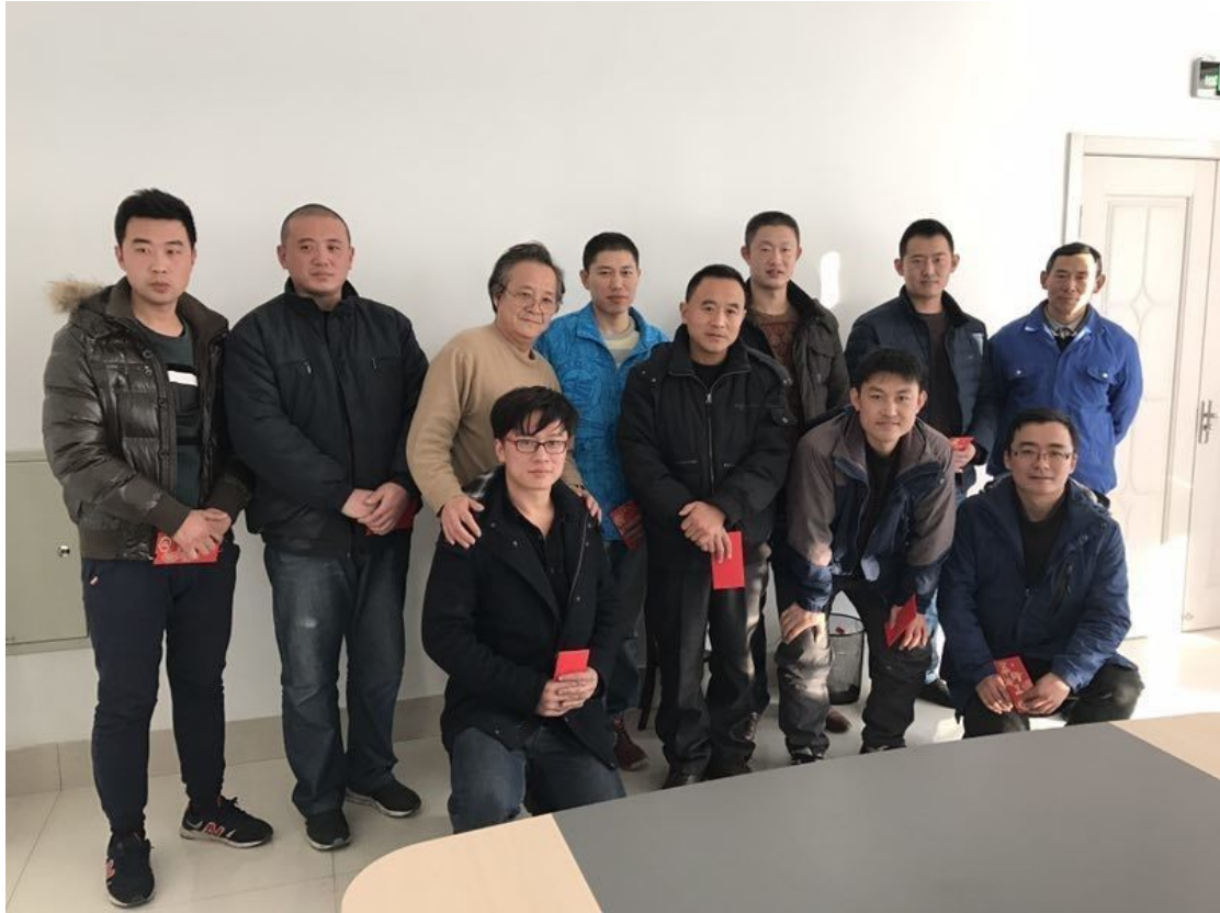
五小发明创新奖获得者