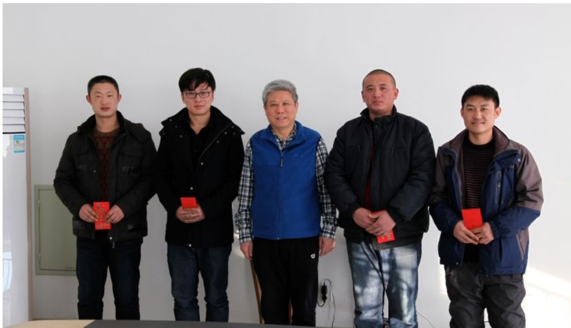
项目成果奖获得者